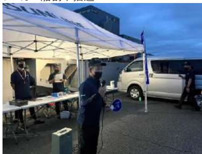
岡山大会委員長挨拶