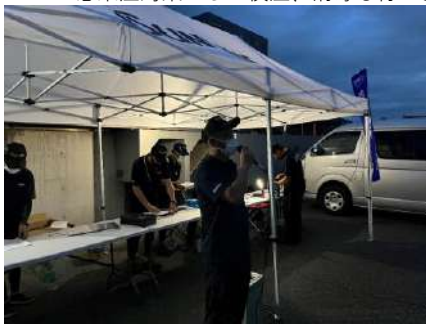
サンライン 西日本支店 支店長 野村より挨拶